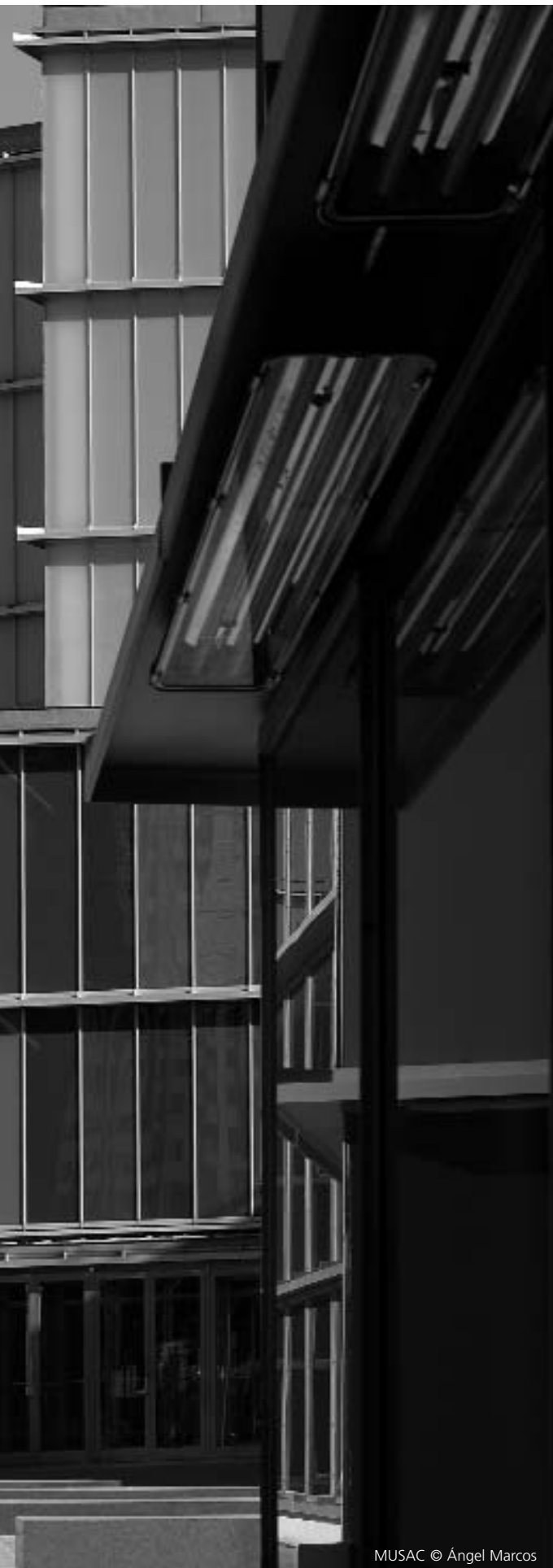
MUSAC © Ángel Marcos

Próximamente invitaremos a los archiveros y otros profesionales de la información y la documentación que desarrollan su labor en la administración pública, empresas, universidades a participar activamente en este Congreso presentando propuestas de comunicaciones y pósters que tengan como tema alguno de los siguientes.