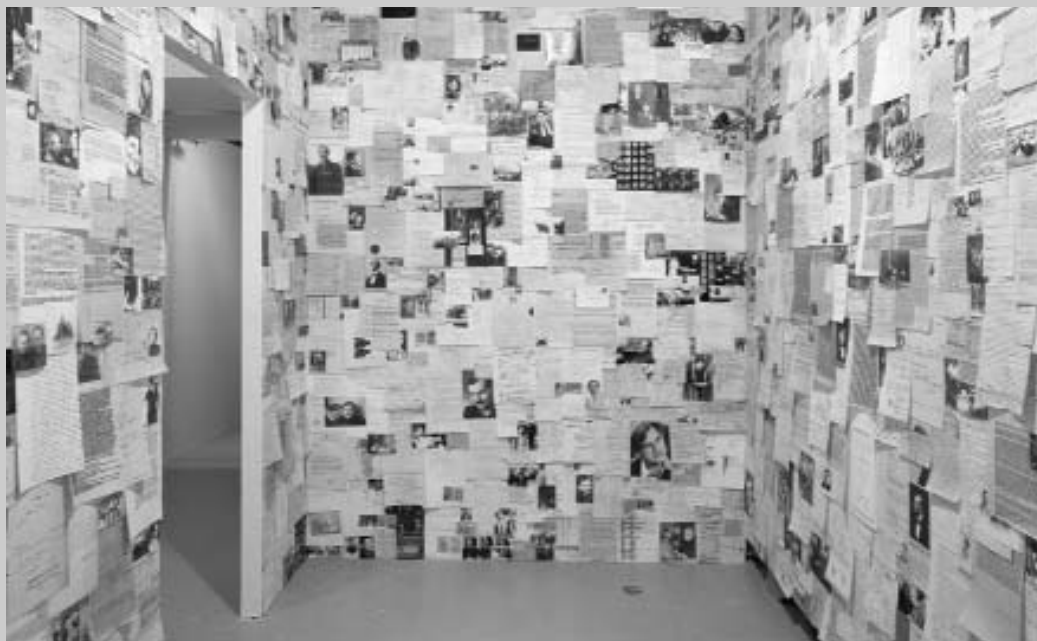
Christian Boltanski. Das ungerordnete Leben von Maxim Vallentin, 2005. Installationsansicht.

Pero sí quisiera terminar con una obra clásica que nada tiene de romanticismo de archivo viejo y sí mucho de archivo contemporáneo y gestión de la información mediante las nuevas tecnologías: The File Room , de Antoni Muntadas. El proyecto, en su versión virtual, ya que también ha tenido versiones instaladas en salas de arte, reflexiona sobre la presencia de la censura en todas las épocas de nuestra existencia. Para ello no recurre a mecanismos tradicionales del arte, muy al contrario, construye un archivo. Un archivo que se alimenta de los casos de censura de cualquier época y lugar y que de manera colectiva crece como un gran instrumento crítico con los envíos que diferentes usuarios hacen a través de la web. Podría haber sido otro el soporte, la alegoría, la metáfora, la pintura, pero no, el archivo, uno de los pilares fundamentales de nuestra cultura, es el "lienzo" elegido para esta obra de arte. ■