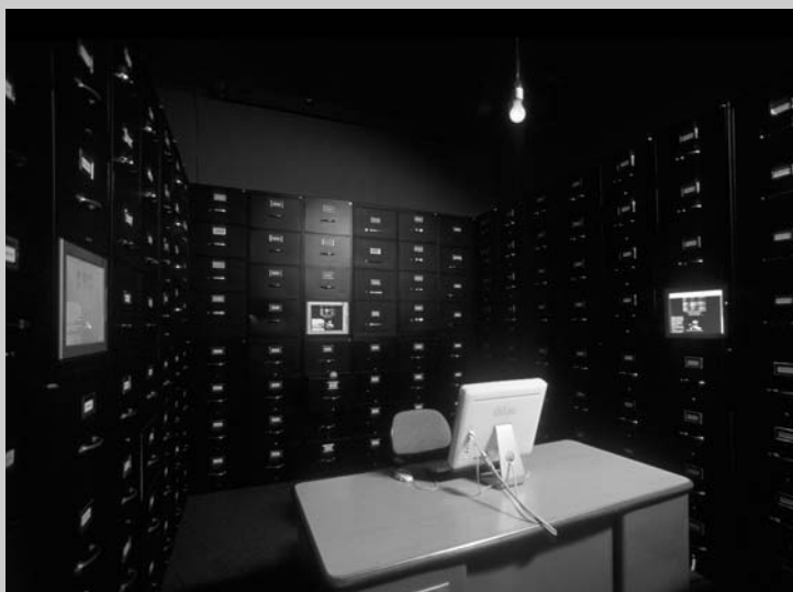
Database Imaginary (Walter Phillips Gallery exhibition) Antonio Muntadas, "The File Room", 1994-2004

De nuevo, más kilómetros de documentación que ordenar para el conservador archivero.